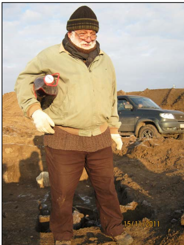
Рис. 7. Всем только горячий чай! Новолабинское городище, 2011 год.

Fig. 7. Nothing but hot tea for everyone! Novolabinskoe Hillfort, 2011