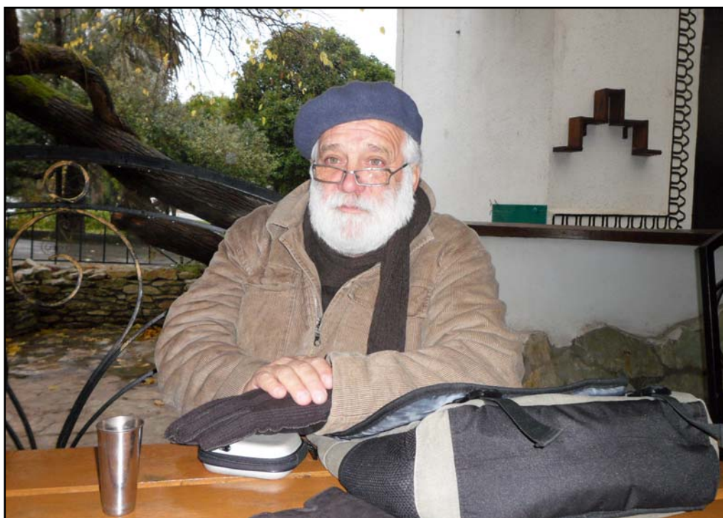
Рис. 9. Любимое кафе на набережной в г. Сухум. Третья международная Абхазская конференция, 2011 год.